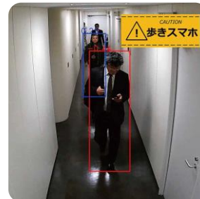
歩きスマホ検出 (異常行動検知)

VIO の映像監視システム ArgosView と ISP の監視カメラソリューション向け AI エンジン SENLI®の連携で、映像監視システムへの録画・蓄積と、AI/Deep Learning 技術による映像解析をワンストップで行います。今回の連携により、新たな付加価値を提供する監視カメラ・監視サービス向けソリューションを実現します。